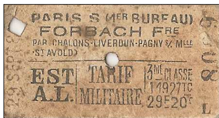
Ticket de chemin de fer réel