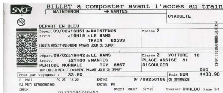
Ticket de chemin de fer réel TGV (Train à Grande Vitesse)