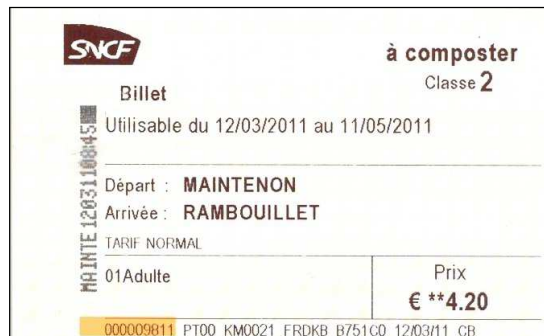
Ticket chemin de fer réel TER (Train Express Régional)